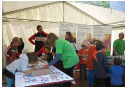
Le stand au Marchethon attire toujours beaucoup d'enfants.