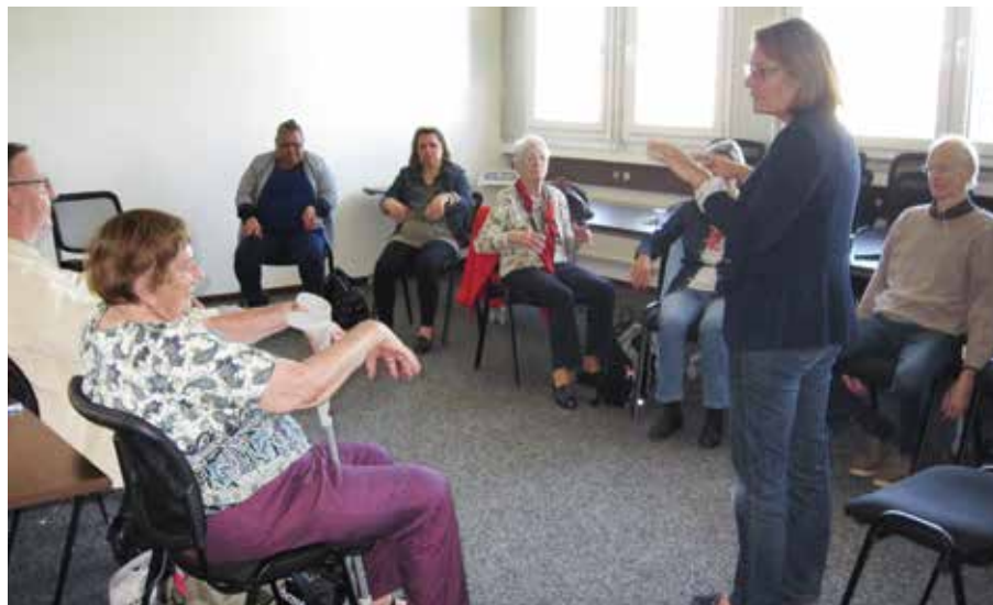
La Journée aérée, une nouveauté 2015 très appréciée des participants.

La Ligue soutient un programme d'éducation thérapeutique destiné aux enfants souffrant d'asthme, âgés de 4 à 12 ans, et à leurs parents, organisé par l'Hôpital de l'Enfance.