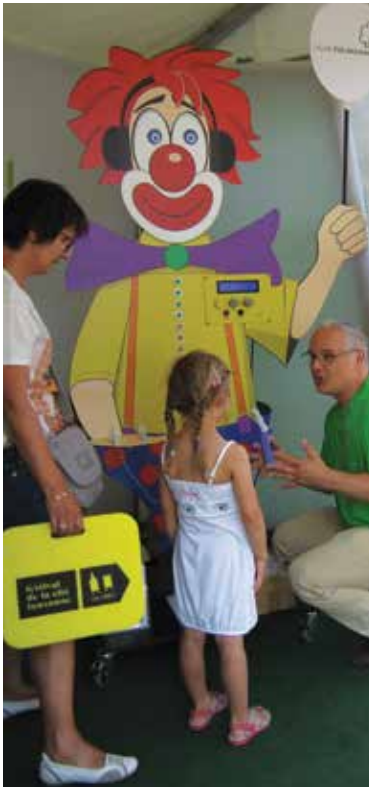
Le stand au Festival de la Cité.

La LPV s'est engagée cette année encore aux côtés de la Ligue pulmonaire suisse dans le travail de lobbying pour la future loi sur les produits du tabac (LPTab). Le Conseil Fédéral a livré son message au Parlement. Celui-ci, renouvelé à l'automne 2015, doit maintenant élaborer la loi. La protection de la jeunesse, à travers une interdiction complète de publicité pour le tabac, est le grand enjeu de cette loi et de l'action de la Ligue pulmonaire.