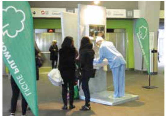
La toux sonore a suscité la curiosité des passants.