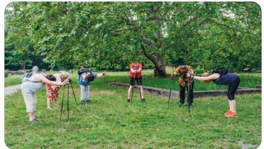
L'échauffement avant la marche nordique apprend aussi à mieux respirer.

Le groupe d'entraide de la sarcoïdose a reçu l'aide conjointe de la Ligue et de Bénévolat Vaud. Le but étant de donner une impulsion au groupe et d'amener ses membres à prendre une part active à la poursuite de ses activités.