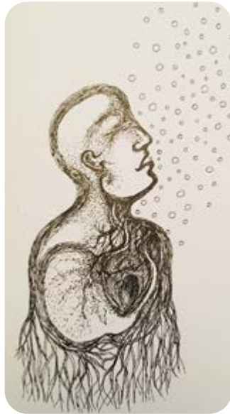
Dessin réalisé par une patiente lors d'une rencontre CPAP pour exprimer la difficulté à respirer.

La pandémie a surtout impacté les Journées aérées. Les rencontres CPAP ont eu lieu régulièrement, parfois en vidéoconférence. Les cours de nordic walking ont suivi une activité régulière.