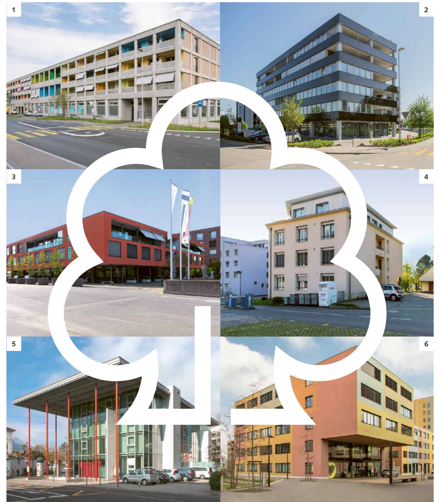
1 | Geschäfts- und Beratungsstelle Emmen Mooshüslistrasse 14, 6032 Emmen